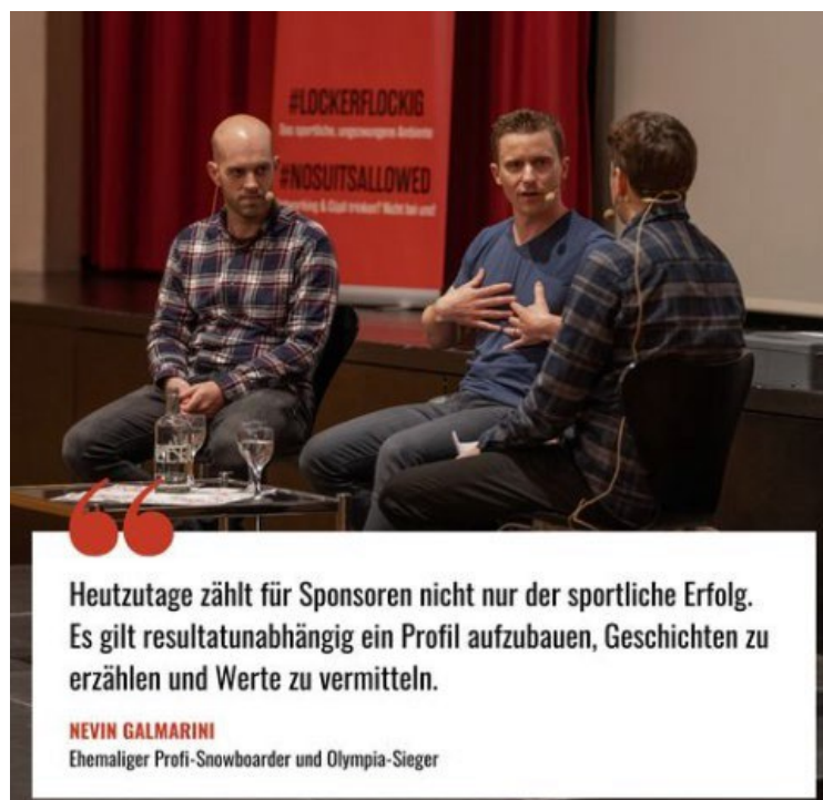
Abb. 5: Sport Management Summit 2023 Landquart